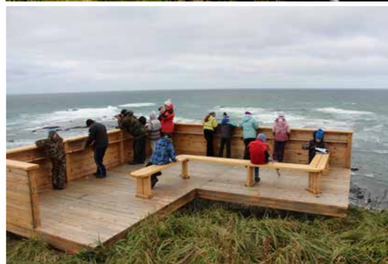
Наблюдение за морскими котиками на Северо-Западном лежбище

Если вы с семьей решили интересно провести выходные и посетить Северо-Западное или Северное лежбища морских млекопитающих, бухты Подутесную или Китовую, тогда вам пригодится наш Рюкзак путешественника! В нем вы найдете: бинокль, простой карандаш, линейку, определители – все, что нужно для наблюдения и изучения животных.