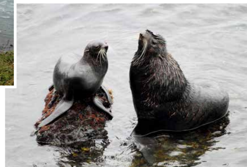
Северный морской котик