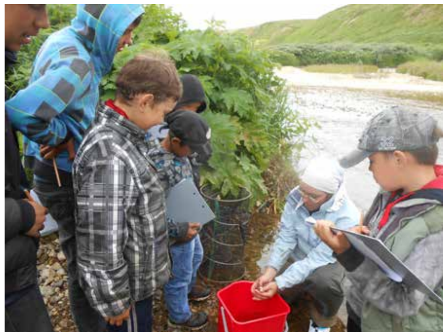
Путешествие с ихтиологом. Бухта Подутесная

В любое время года для любителей природы на Командорских островах найдется, что посмотреть. Осенью и зимой острова посещают перелетные птицы, весной просыпается тундра, появляются первые золотистые рододендроны, на лежбища возвращаются гордые сивучи и северные морские котики, на острова прилетают топорки, ипатки, кайры и другие птицы. В летний период в реки острова Беринга массово заходят на нерест нерка и горбуша.