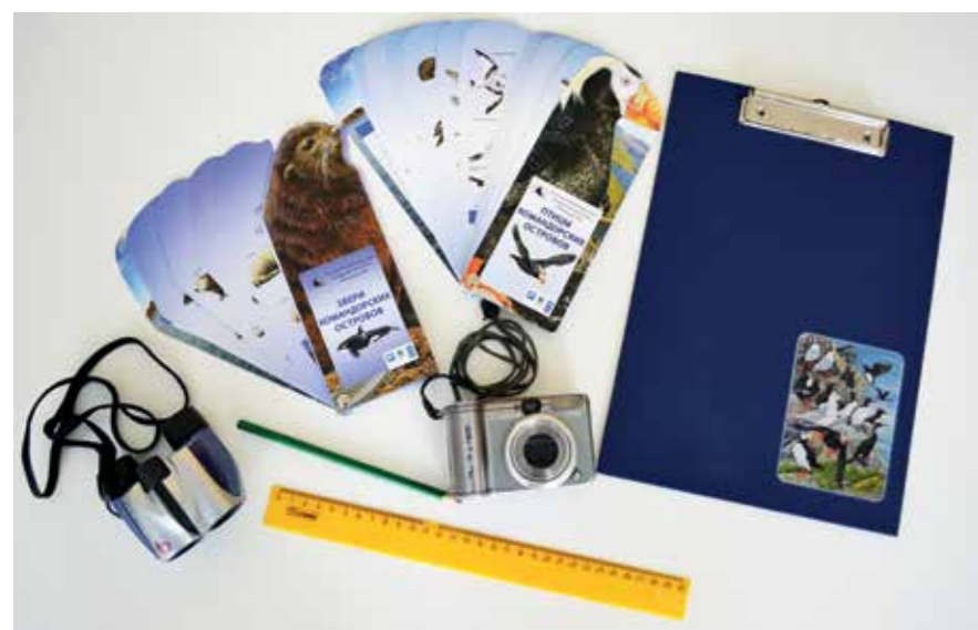
Набор для наблюдений

Если вы с семьей решили интересно провести выходные и посетить Северо-Западное или Северное лежбища морских млекопитающих, бухты Подутесную или Китовую, тогда вам пригодится наш Рюкзак путешественника! В нем вы найдете: бинокль, простой карандаш, линейку, определители – все, что нужно для наблюдения и изучения животных.