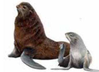
Северный морской котик