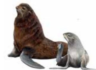
Северный морской котик