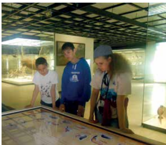
В Государственном Дарвиновском музее