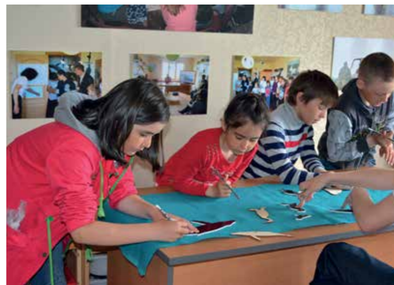
Рисунок на ткани «Животные заповедника»