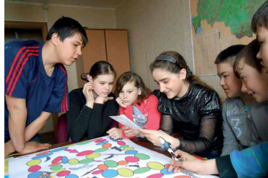
Экологическая игра «Животные заповедника «Командорский»»