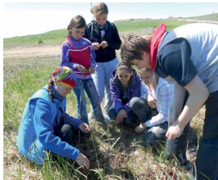
Путешествие с ботаником