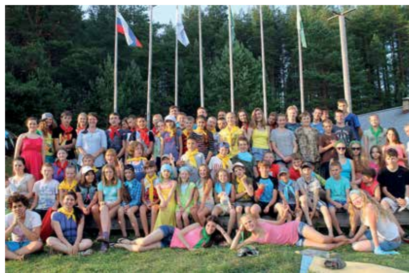
Экологический лагерь Кенозерья 2014 г.