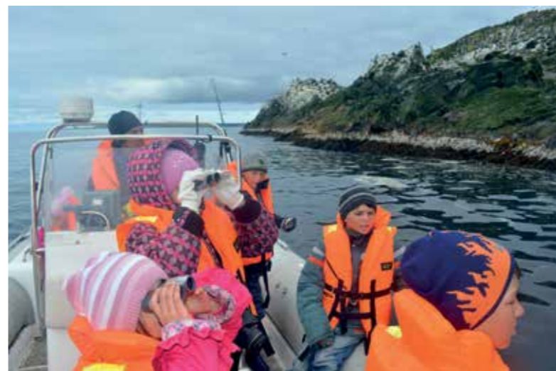
Путешествие к птичьим островам