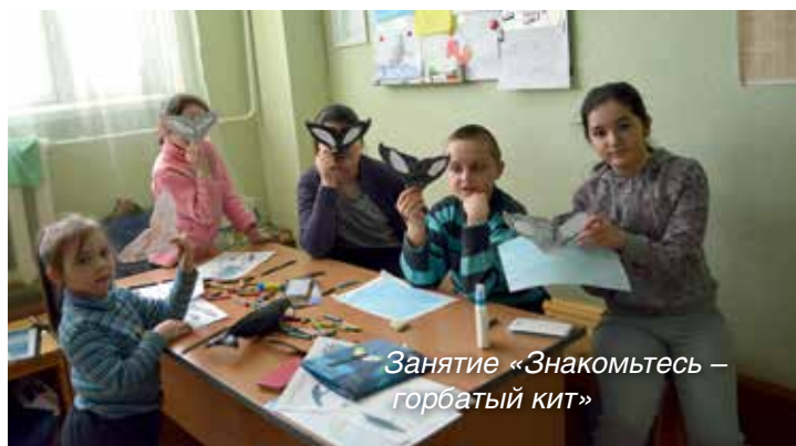
Занятие «Знакомьтесь – горбатый кит»

Экологическая гостиная заповедника «Командорский» отметила третью годовщину своего создания.