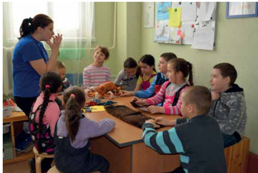
Занятие «Морская выдра - калан»

В 2012 году, после проведения подробного анализа деятельности заповедника в сфере экологического просвещения, общения с жителями села Никольского и с коллегами из других природоохранных учреждений, стала очевидной необходимость разработки и внедрения новых методов и форм эколого-просветительской работы. Название родилось само собой: гостиная – комната, где всем находится место, где, с одной стороны, собираются все домашние, чтобы пообщаться друг с другом, а с другой – это самое нарядное помещение, куда приглашают гостей. Это комната с великолепным видом из окна, с большим телевизором, где можно и пить чай за неспешной беседой, и рисовать, и творить, и играть.