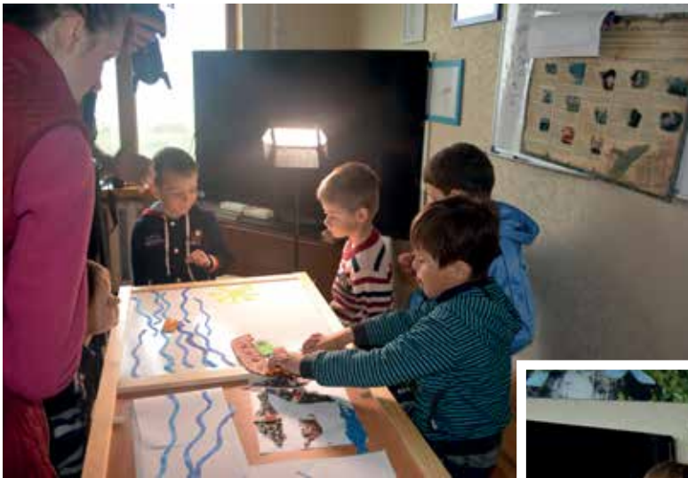
Съемка мультфильма «Мусор в океане»