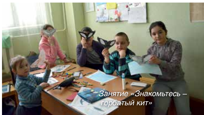
Занятие «Знакомьтесь – горбатый кит»

Экологическая гостиная заповедника «Командорский» отметила третью годовщину своего создания.