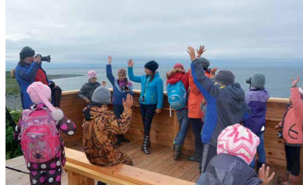
Путешествие на Северо-Западное лежбище

Летом 2013 года в рамках проекта Экологическая гостиная впервые для школьников были организованы выездные экскурсии на острове Беринга. Ребята побывали на Северном и Северо-Западном лежбищах, в бухтах Подутесной и Китовой, познакомились с работой ученых: орнитологов, ихтиологов, ботаников, зоологов, и сами проводили учеты животных.